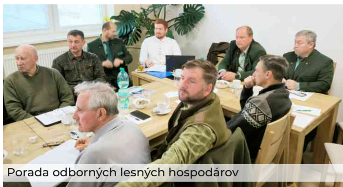
Porada odborných lesných hospodárov