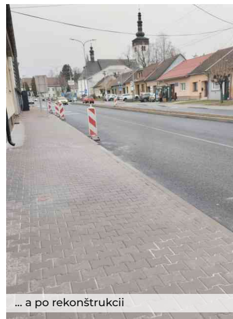
... a po rekonštrukcii