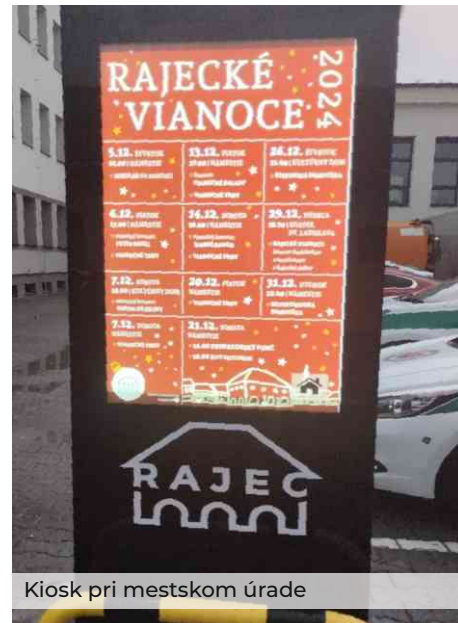
Kiosk pri mestskom úrade

priblíži celú Rajeckú dolinu bližšie k dostupnejšej starostlivosti o duševné zdravie našich detí.