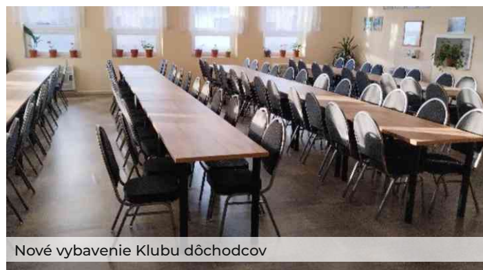
Nové vybavenie Klubu dôchodcov