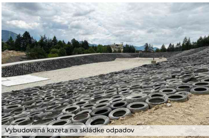
Vybudovaná kazeta na skládke odpadov