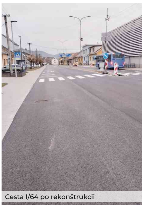
Cesta I/64 po rekonštrukcii

Okrem predchádzajúcich investičných akcií sme sa počas roka zaoberali aj aktivitami, ktoré sa priamo dotýkali občanov nášho mesta.