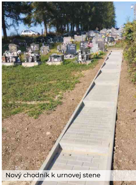
Nový chodník k urnovej stene