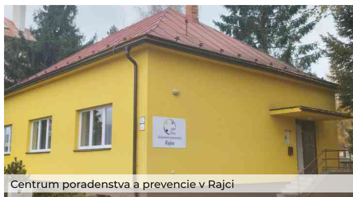
Centrum poradenstva a prevencie v Rajci