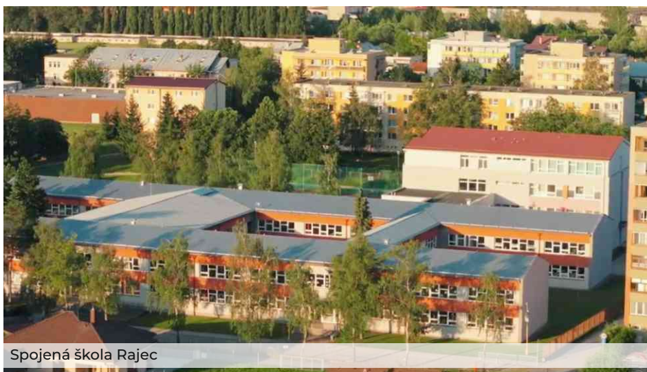
Spojená škola Rajec