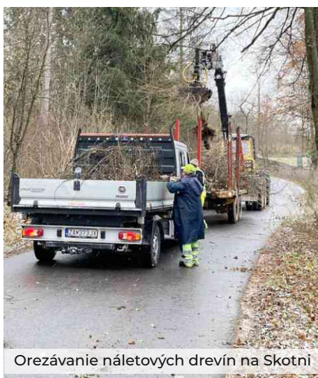
Orezávanie náletových drevín na Skotni