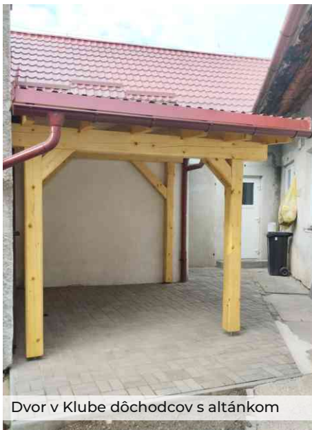
Dvor v Klube dôchodcov s altánkom