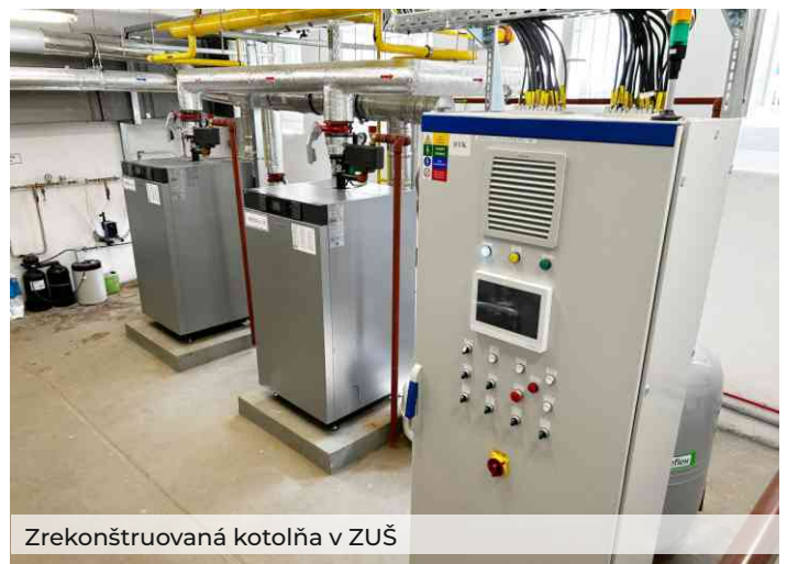
Zrekonštruovaná kotolňa v ZUŠ