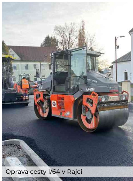
Oprava cesty I/64 v Rajci