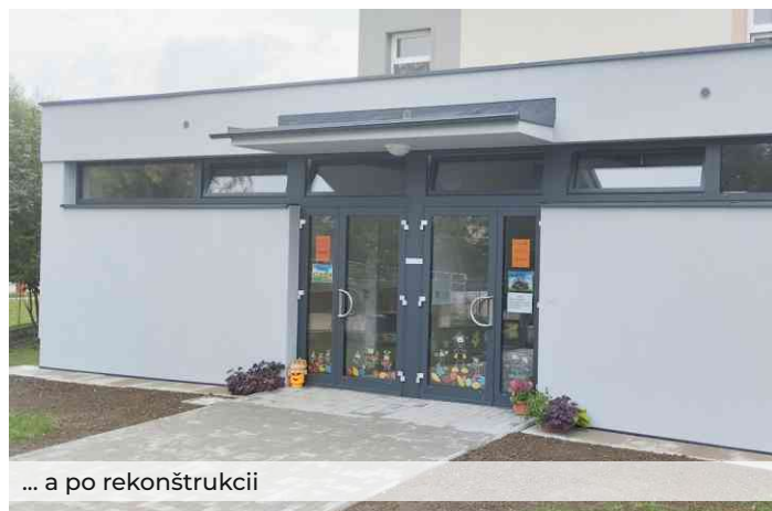
... a po rekonštrukcii

nové hrobové miesta. Podarilo sa nám vytvoriť priestor na viac ako 100 nových hrobových miest.