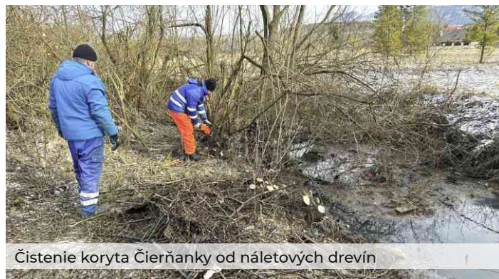
Čistenie koryta Čierňanky od náletových drevín

Ďakujem všetkým občanom, zamestnancom mesta, poslancom MZ, podnikateľom, klubom a občianskym organizáciám, ktorí akýmkoľvek spôsobom pomáhajú rozvoju mesta. Venujú mu svoj čas, energiu a niektorí aj finančné prostriedky. Vážim si korektnú spoluprácu, vecnú diskusiu a dobré nápady, ktoré prispievajú k napĺňaniu nášho spoločného cieľa.