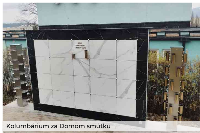
Kolumbárium za Domom smútku