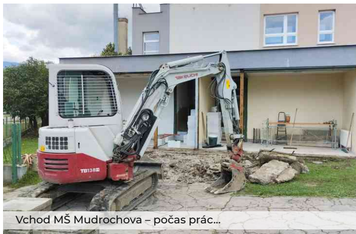
Vchod MŠ Mudrochova – počas prác...