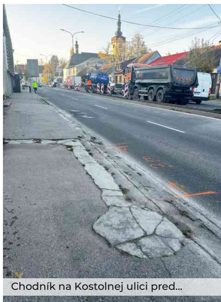
Chodník na Kostolnej ulici pred...