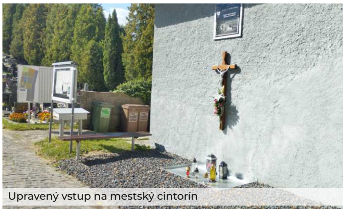
Upravený vstup na mestský cintorín