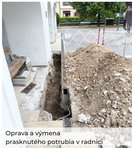
Oprava a výmena prasknutého potrubia v radnici