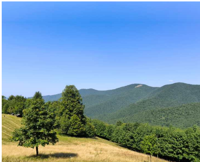
Usypaná skala, pohľad z Jaseňa