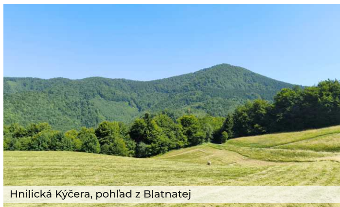
Hnilická Kýčera, pohľad z Blatnatej