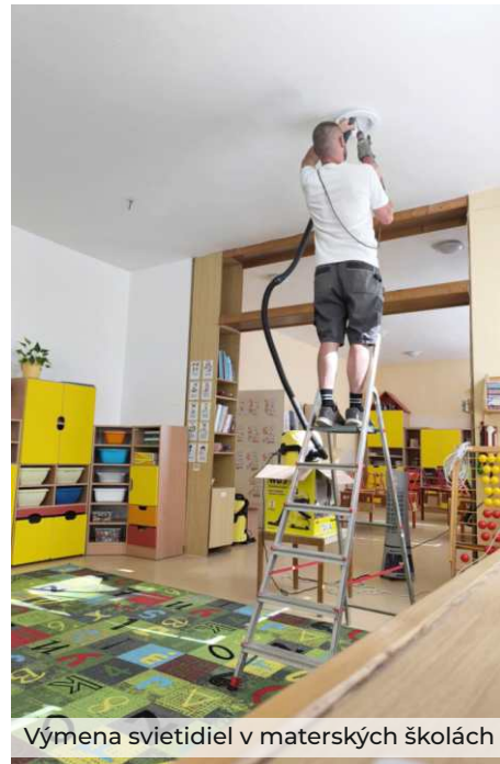
Výmena svietidiel v materských školách