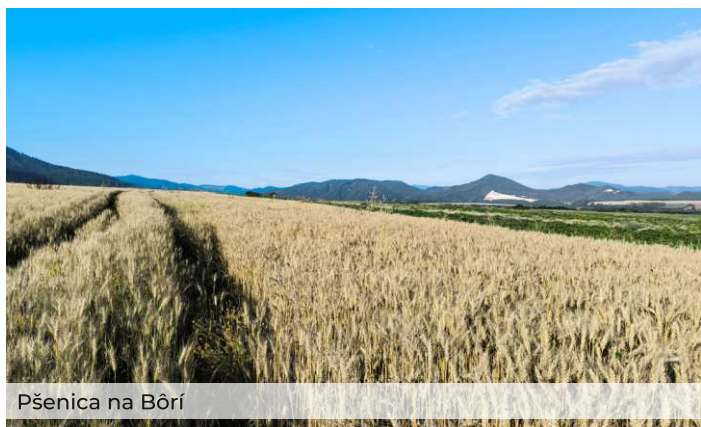
Pšenica na Bôri