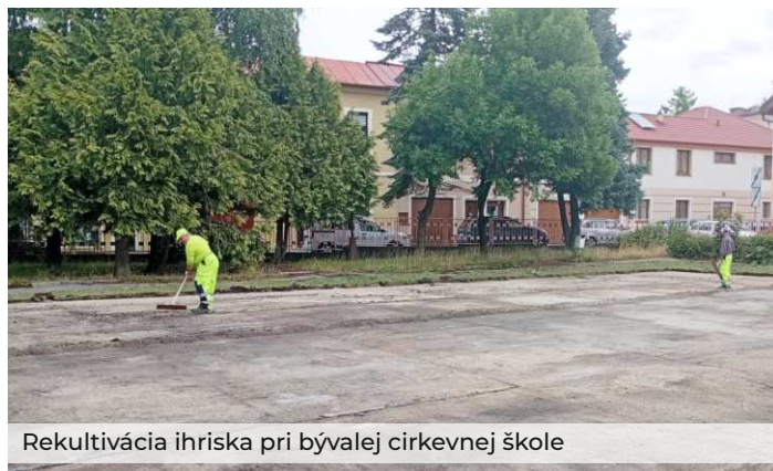
Rekultivácia ihriska pri bývalej cirkevnej škole