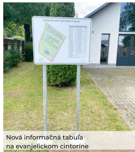
Nová informačná tabuľa na evanjelickom cintoríne