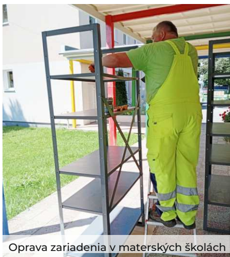
Oprava zariadenia v materských školách