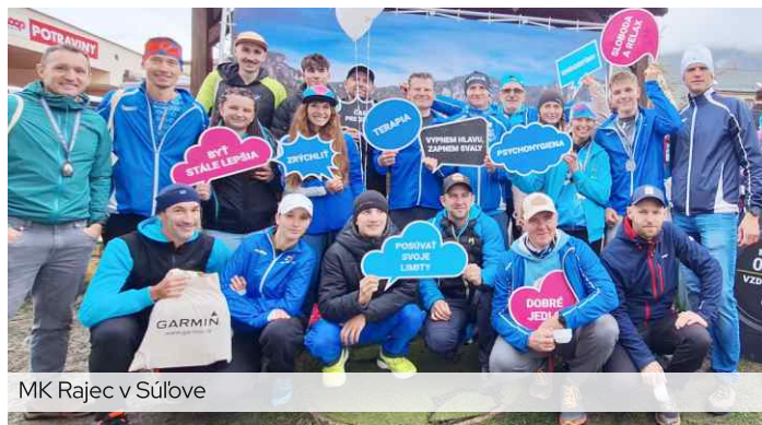
MK Rajec v Súľove