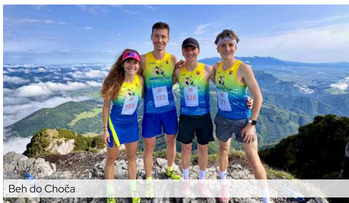
Beh do Choča

sedemkrát umiestnil. Popri organizovaní dokáže stále potiahnuť mladších a ukázať, že športovať sa dá aj vo vyššom veku. Okrem bežeckých pretekov na ceste a v horách, sa postavil aj na štart pretekov v bežeckom lyžovaní a horskej cyklistike.